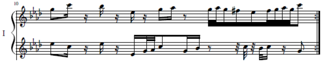
شكل رقم (٨) (١٠م) تقسيم داخل الوحدة وتتابع لحني للعازف الأول

وهذه التقنية تتطلب تآزر بين اليدين ومرونة في حركة الأصابع لأداء التقاسيم الداخلية للوحدة ولأداء التتابع اللحني للنغمات أداء صحيحاً، كما في موازير (٩م، ١٠م، ٣٠م، ٣١م) والتي استخدم فيها المؤلف مقام الفريجيان المصور على درجة (دو) وينتهي في نفس المقام، ومثال ذلك في الشكل التالي: