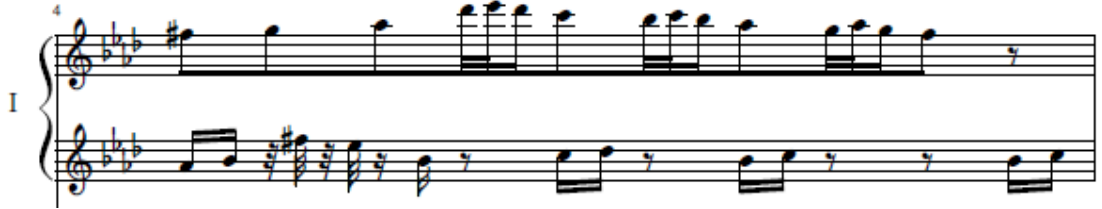
شكل رقم (٥) (٤م) تقسيم داخلي مع مكمل إيقاعي للعايزف الأول

تعتمد هذه التقنية على مرونة حركة الأصابع للعايزف وضبط الوحدة وقد ظهرت هذه التقنية في الموازير (٤م، ٩م، ٢٤م، ٣٠م) لذا يرى الباحث ضرورة التدريب ببطء شديد مع مراعاة التبادل بين اليدين بأسلوب المكمل الإيقاعي بين اليد اليمنى واليد اليسرى للعايزف الأول، ونلاحظ استخدام المؤلف في هذه الموازير لمقام الفريجيان ومقام الليديان كما في الموازير من (٤م-١٠م)، ومثال ذلك في الشكل التالي: