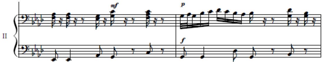
شكل رقم(١٢) (م١٧، م١٨) تألف هارموني على وحدة الدوبل كروش فى لحن اليد اليمنى للعازف الثانى

ظهر فى لحن اليد اليمنى بعض التألفات الثلاثية بزمن الكروش (♩) والدوبل كروش (♩♩) فى اليد اليمنى ( م ١٧ - م ١٩ ) وذلك يشكل صعوبة لدى الدارس . لذا يجب أن تكون اليد والأصابع في استدارة كاملة لتساوى الضغط على النغمات ، وأن تكون نغمات الأوكتاف في قوة واحدة مما يتطلب التدريب عليها ببطء، ومثال ذلك فى (م١٧) فى الشكل التالي: