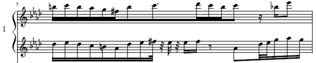
شكل رقم (٦) (٥م) أداء النغمات المتماثلة بمسافات هارمونية للعايزف الأول

يظهر في هذه التقنية تتابع للنغمات كما جاء بالتقنية رقم (ب-١-٢) بالإضافة إلى أن النغمات على بعد مسافات مختلفة كما ظهر في (٥م، ٨م، ٢٦م، ٣٢م) ويتطلب أداء تلك التقنية أن تكون النغمتان في قوة واحدة مما يتطلب التدريب عليها ببطء لكي تسمع النغمات متتابعة وبقوة لمس واحدة بين اليدين للعايزف، ومثال ذلك في الشكل التالي: