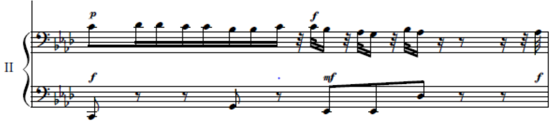
شكل رقم (١٠) (م ٦) تتابع لحنى مع الضرب الإيقاعى للعازف الثانى

ظهرت هذه التقنية فى اليد اليمنى للعازف الثانى فى الموازير (م ٦، م ٧، م ١٠) ويتطلب أداء تلك التقنية الأحساس بالوحدة ومرونة لحركة الأصابع لليد اليمنى للعازف، والشكل التالى يوضح ذلك