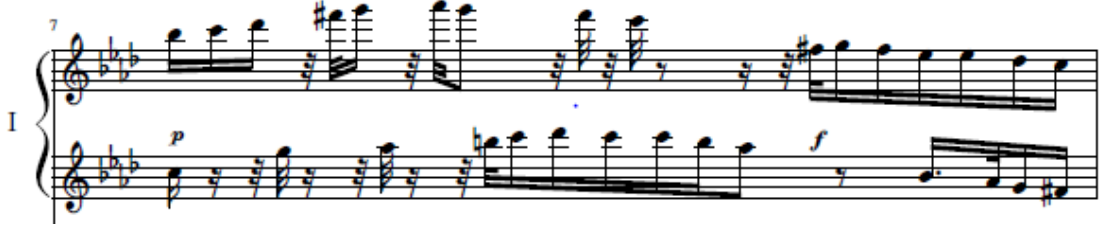
شكل رقم (٧) (٧م) مكمل إيقاعي في اليد اليمنى وتتابع لحني باليد اليسرى للعازف الأول

تعتمد هذه التقنية على المكمل الإيقاعي الذي ظهر في لحن اليد اليمنى والتتابع اللحني في اليد اليسرى كما جاء في (٧م) ويتطلب أداء تلك التقنية مرونة في حركة الأصابع مع الأحساس بضبط الوحدة والتآزر بين اليدين ولهذا ينصح الباحث بالتدريب ببطء شديد للتمكن من الأداء الجيد لتلك التقنية، ومثال على ذلك في الشكل التالي.