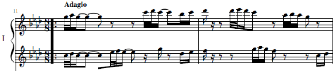
شكل رقم (٣) (م ١١، م ١٢) تبادل ما بين اليدين في تتابع الوحدات للعازف الأول