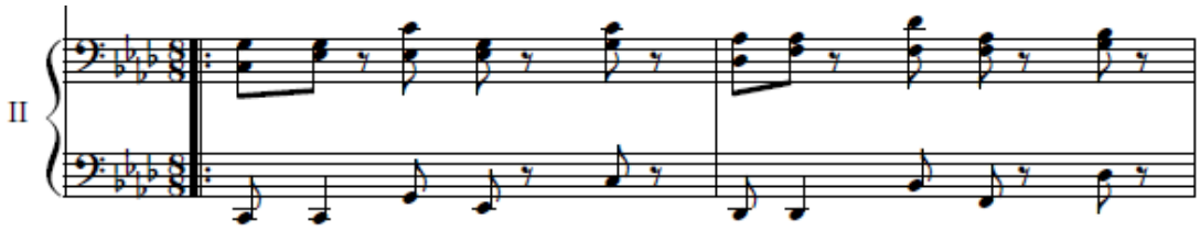
شكل رقم(١١) (م١١)مسافات هارمونية باليد اليمنى وضرب بلدى باليد اليسرى للعازف الثانى

الحركى بين اليدين للتحكم والسيطرة على أداء لحن اليد اليمنى وأداء المسافات الهارمونية المتتالية يتطلب أن تكون اليد والأصابع في استدارة كاملة لتساوى الضغط على النغمات ، كما بالشكل التالي: